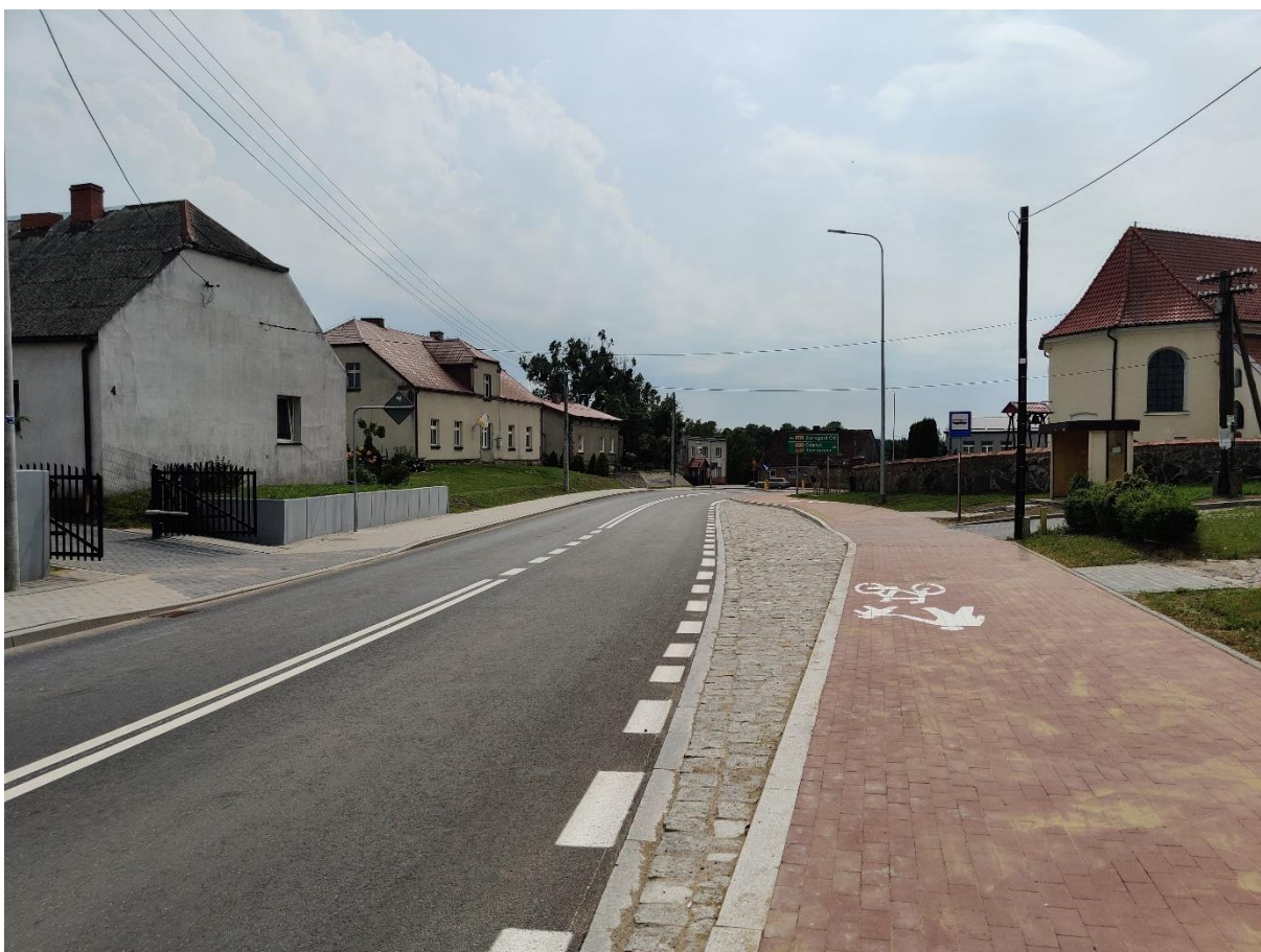
Rozbudowa drogi wojewódzkiej nr 224 na odcinku Godziszewo – węzeł Autostrady A1 Stanisławie, etap 1 Godziszewo Regionalny Program Operacyjny dla Województwa Pomorskiego na lata 2014-2020