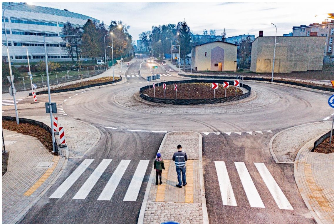
koniec opracowania Sporządził – Jan Domsta